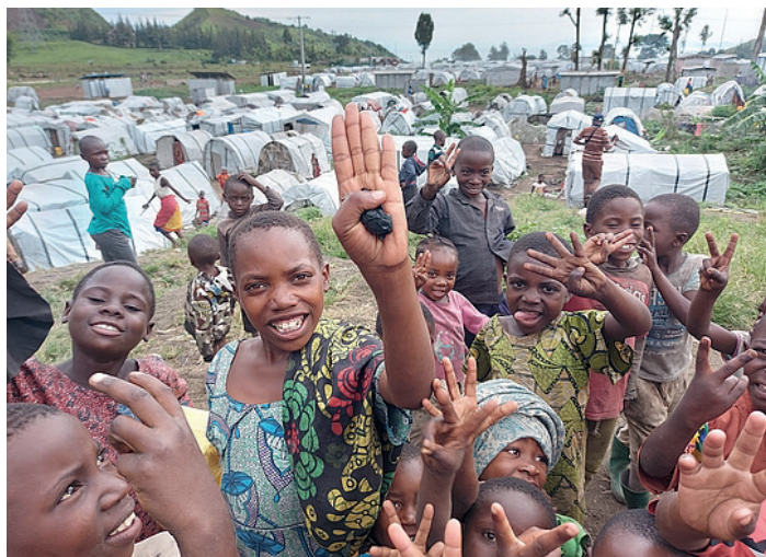
(Monat der Weltmission – Oktober 2024)

Diese Worte richtet Jesus an die beiden Brüder Jakobus und Johannes, die um einen Platz zu seiner rechten und linken Seite baten. Diese Bitte spiegelt einen tiefen Wunsch wider, den wir alle in uns tragen – das Bedürfnis nach Grösse, Kontrolle und Anerkennung. Ähnlich wie bei den Brüdern werden auch wir manchmal von unseren eigenen Wünschen und Schwächen angetrieben. Wir sehnen uns nach Bedeutung und Macht, oft ohne dabei Gottes Willen zu berücksichtigen. Lassen Sie uns daher gemeinsam darüber nachdenken, wie wir unser Herz für Gott öffnen können und nicht in Selbstzweckhaftigkeit verfallen.